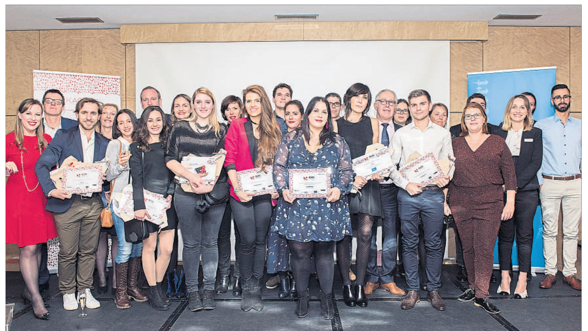
Les différents gagnants et le jury des «KACHEN Blog Awards».

Prix du Public dans la catégorie Food: https://f4od.wordpress.com/ Prix du Public dans la catégorie Lifestyle: http://noraschi.com/ Prix du Jury dans la catégorie Food: http://thegreencreator.com/ Prix du Jury dans la catégorie Lifestyle: http://kinlake.com/ Coup de cœur du Jury: http://www.degrengeliw.com/ Coup de cœur du Luxemburger Wort: https://cookerei.com/ Prix Spécial «Food» Cactus: https://lariviererose.com/ Prix Spécial «Food & Lifestyle» Neff: https://platefulnutrition.co/