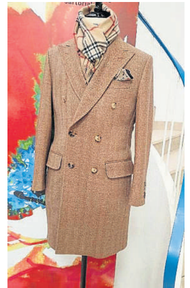
Envie de porter un vêtement exclusif et unique: la boutique Palladio est la bonne adresse.